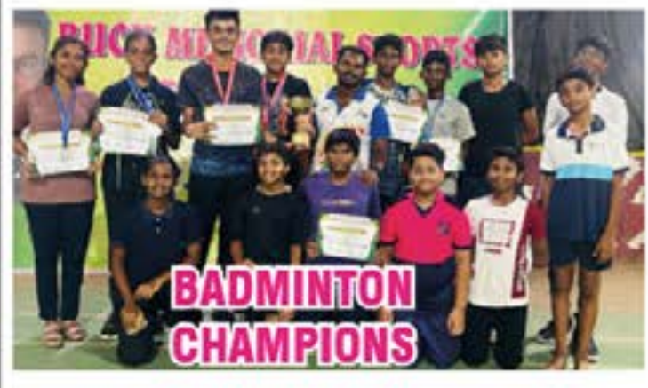
BADMINTON CHAMPIONS Velammal Vidyalaya Annexure is thrilled to announce the remarkable achievements of its students at the Buck Memorial Badminton Tournament. Our talented young athletes demonstrated exceptional skill and sportsmanship, bringing home several prestigious awards. The tournament results for Velammal Vidyalaya Annexure are as follows: U-17 Boys Doubles Winner, U-15 Boys Singles Runner-Up, U-13 Girls Singles Runner-Up, U-17 Girls Runner up.