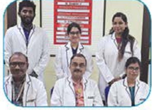
டாக்டர், மூக்கு, தொண்டை (ENT) துறை மருத்துவர்கள்

தொடர்ந்தால், அவர்கள் விரைவில் திரந்தக் காதுகேட்பு கருவி வைத்துக் கொள்ளும் நிலைக்கு ஆளாயார்கள். எனவே, காதுக்கு வெளியில் பொருத்தும் ஹெட் போன் பயன்படுத்தலாம்..." என்று ஆலோசனை சொன்னார்.