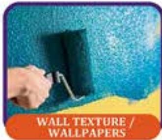
WALL TEXTURE / WALLPAPERS