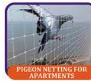
PIGEON NETTING FOR APARTMENTS