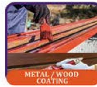
METAL / WOOD COATING