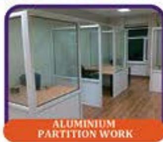
ALUMINIUM PARTITION WORK