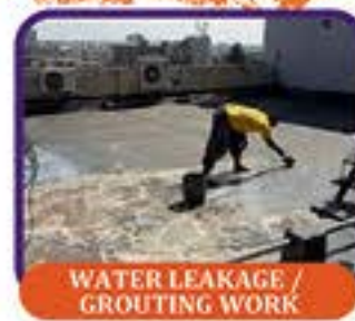
WATER LEAKAGE / GROUTING WORK