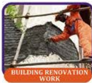
BUILDING RENOVATION WORK