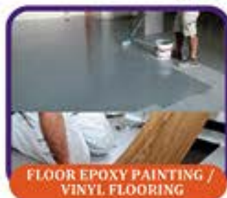
FLOOR EPOXY PAINTING / VINYL FLOORING