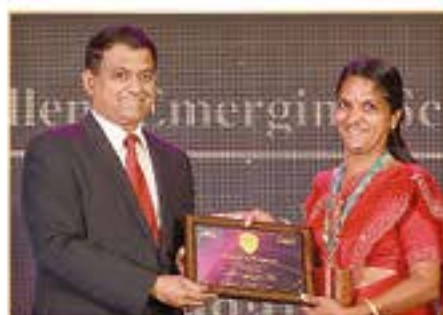
EXCELLENT EMERGING SCHOOL AWARD ( VANAGARAM )