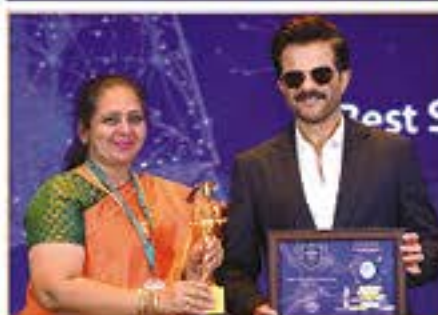
BEST SCHOOL IN LIFESKILL DEVELOPMENT AWARD ( MANGADU )