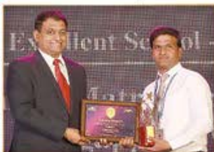
EXCELLENCE IN CREATIVE THINKING AWARD (VELAMMAL MATRIC. HR. SEC. SCHOOL)