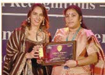
INNOVATIVE LEARNING SCHOOL AWARD ( AVADI )