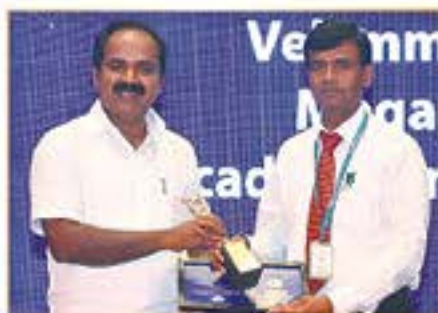
BEST SCHOOL FOR ACADEMIC INNOVATIVE CURRICULUM ( WEST )