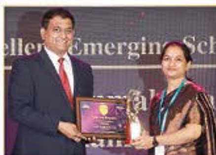
INNOVATION EXCELLENCE IN STEM AWARD ( NOLAMBUR )