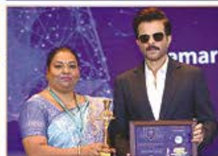
REMARKABLE CONTRIBUTION IN PROGRESSIVE EDUCATION ( KARAMBAKKAM )