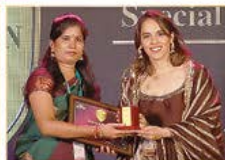
EXCELLENT EXPERIENTIAL LEARNING SCHOOL AWARD ( VKIDS - WEST )