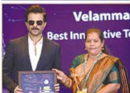
BEST INNOVATIVE TEACHING SCHOOL ( POONAMALLEE )