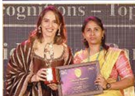
PROMISING SCHOOL OF THE YEAR ( PARUTHIPATTU )