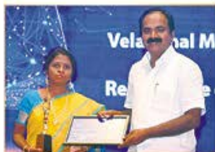
INNOVATIVE LEADERSHIP AWARD (VELAMMAL MATRIC. HR. SEC. SCHOOL)